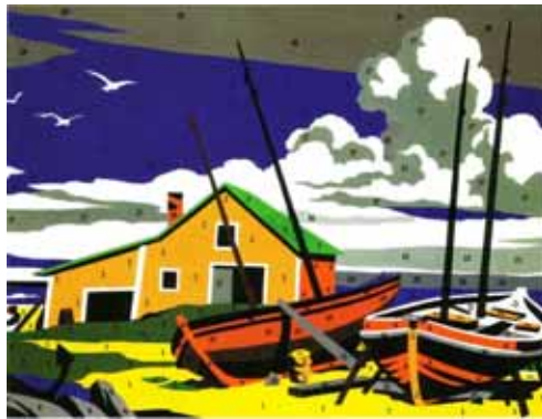
Do it yourself (Seascape) von 1962

Hier unten, im Herz des Bahnhofs wird es spannend. Hier ist Andy Warhol ausgestellt. Den halte ich für den wichtigsten Künstler des ausgehenden 20. Jahrhunderts. Ein Bild besonders hat mich fasziniert. Ich habe den Hamburger Bahnhof schon besucht, nur um mir dieses eine Bild noch einmal anzugucken.